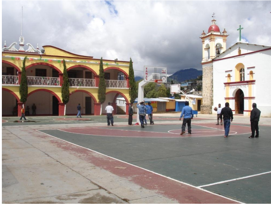
Explanada principal del municipio con el templo católico