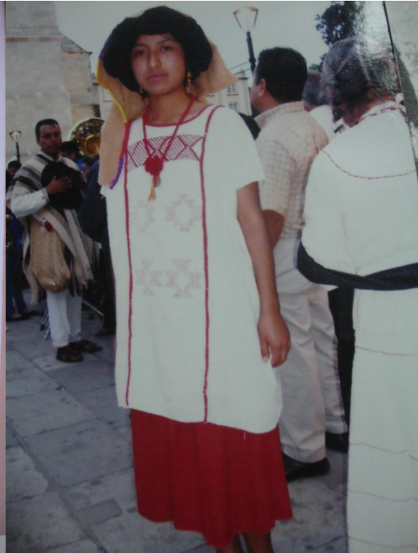
TRAJE DE COTZOCON