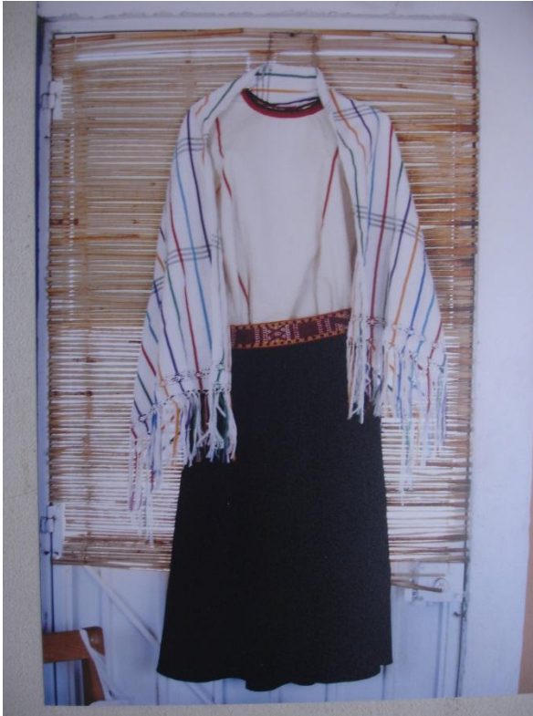
TRAJE DE TAMAZULAPAM